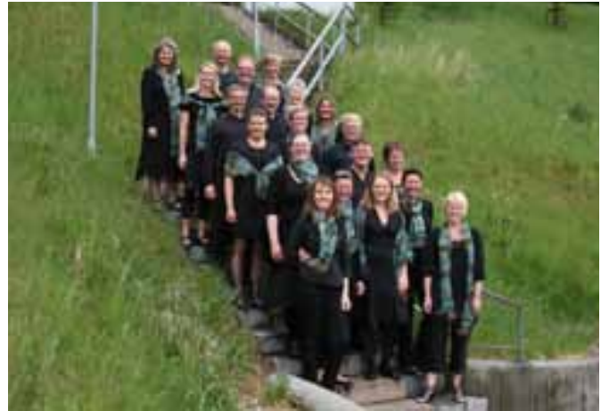
Her er de hjemme i Danmark.

Vi har lige haft besøg af koret Courage fra Silkeborg, og det var en helt fantastisk aften for alle.